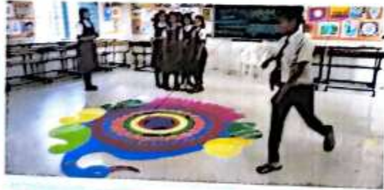
रंगोळी स्पर्धा क्षणचित्र