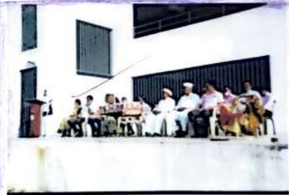
छत्रपती शिवाजी महाराज जयंती